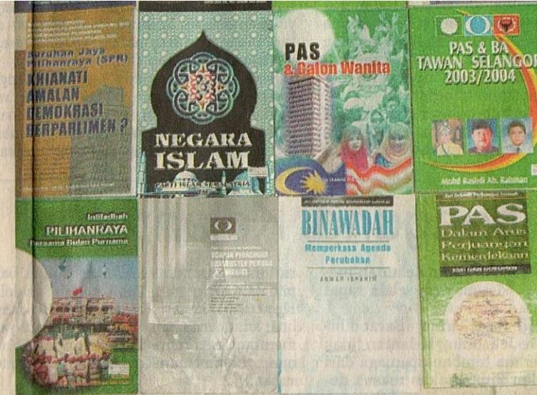
PERKEMBANGAN politik tanah air mendorong lebih banyak buku politik diterbitkan.

Krisis dalaman kepimpinan Pemuda UMNO juga sering dijadikan bahan penulis politik maka kita dapat membaca Kemelut Baru Pemuda UMNO! dan Dilem-